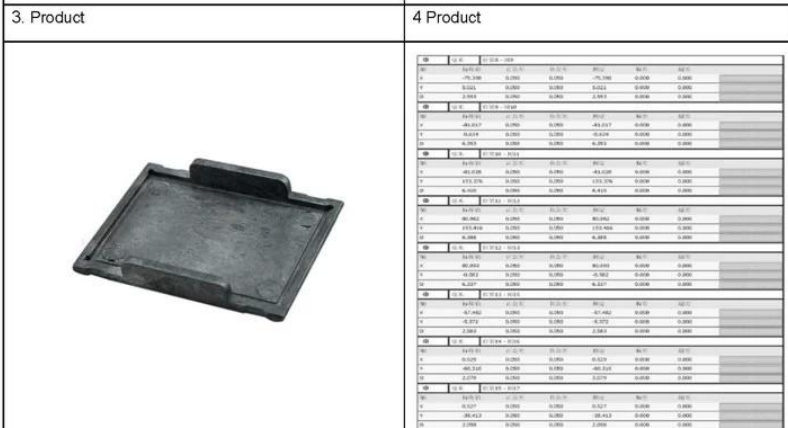
5. Product: 6. The test report