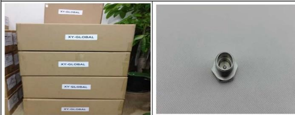
1. Packing 2. Product: