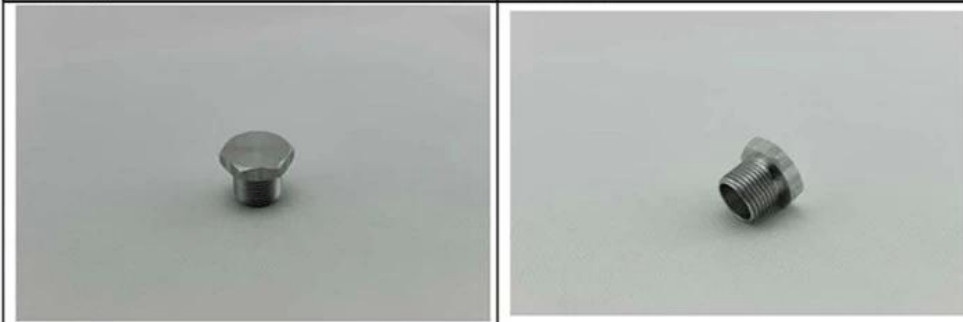
3. Product: 4. Product: