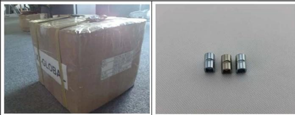
1. Packing 2. Product