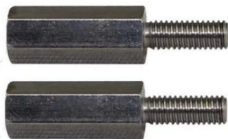
5. Product :