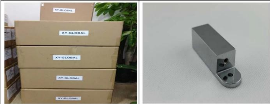
1. Packing 2. Product