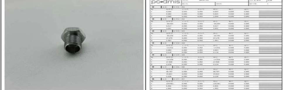
5. Product : 6. inspection reports