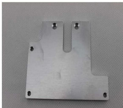
5. Product :400-01-075