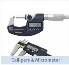
Callipers & Micrometer